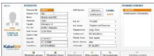
Abb.: Aktendeckel Mitarbeiterakte

Entwicklungsprojekt gegeben. Ausschlaggebend war die kurze Implementierungszeit zur Einführung des Systems: Nicht mehr als fünf Tage benötigte IQDoQ, um seine Lösung an die Kundenbedürfnisse anzupassen, diese gemeinsam mit der IT-Abteilung des Kunden zu installieren und die Personalsachbearbeiter darauf zu schulen. Bereits in der Schulung wurden die ersten Bestandsakten erfasst und produktiv mit der digitalen Personalakte gearbeitet. Seit Mai läuft die Lösung nun im umfassenden Produktivbetrieb. ...hier weiterlesen