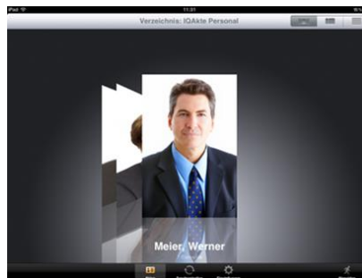
Abb. 2: IQAkte Personal.App