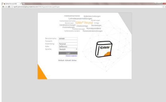
Abb. 1: Anmeldung am Web-Client