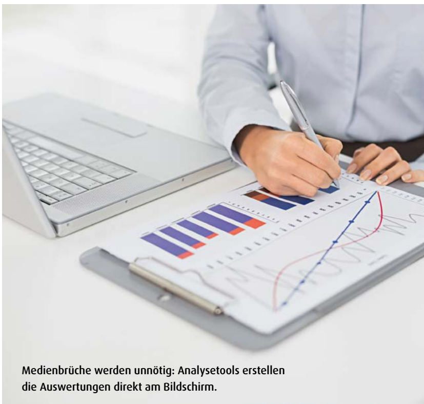
Medienbrüche werden unnötig: Analysetools erstellen die Auswertungen direkt am Bildschirm.

Zum anderen sollte die Softwarelösung interaktive Analysen ermöglichen, damit sich der Erkenntnisgewinn schrittweise vollziehen kann. Bei der Visualisierung idealerweise auf einen Blick erkannte